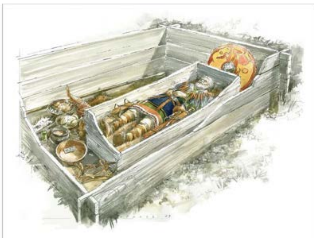
Reconstitution d'une chambre funéraire dans l'est de la France, au Moyen Âge.